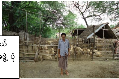
မင်းဘူးမြို့ နယ် မွေးမြူရေးအစုအဖွဲ့ ပုံ