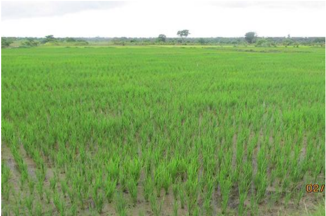
ရေနံချောင်းမြို့၊ နယ်ဆည်ရွာရှိ ပေါင်းစည်းလယ်ယာဆောင်ရွက်ထားရှိမှု မှတ်တမ်းဓာတ်ပုံ