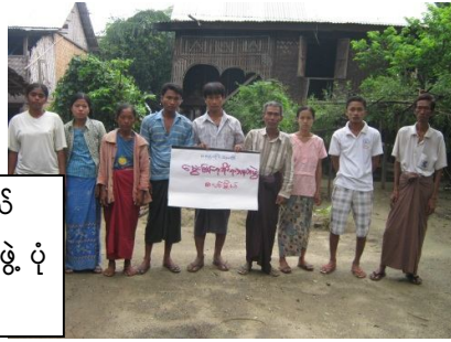
စလင်းမြို့ နယ် မွေးမြူရေးအစုအဖွဲ့ ပုံ