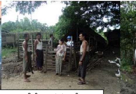
သရက်မြို့ နယ်မြစ်ကိုင်းကျေးရွာ ဆိတ်အစုအဖွဲ့ ဖွဲ့ စည်းနေပုံ